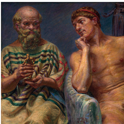
Sokrates og Alkibiades, 1911 Statens Museum for Kunst

Den gamle filosof Sokrates sidder med en guldskulptur i hånden, mens den unge Alkibiades ser optaget på ham. I antikkens Grækenland var mandlig homoseksualitet anset som noget, der kunne føre til den højeste indsigt. Helt anderledes var det på Zahrtmanns tid, hvor det var forbudt at være praktiserende homoseksuel mand. I maleriet har Zahrtmann anvendt en fortidig situation til at kommentere på sin egen samtid. Manden, som stod model til Alkibiades, var nemlig en af de homoseksuelle mænd, der blev retsforfulgt under Den store Sædelighedssag i årene 1906-07.