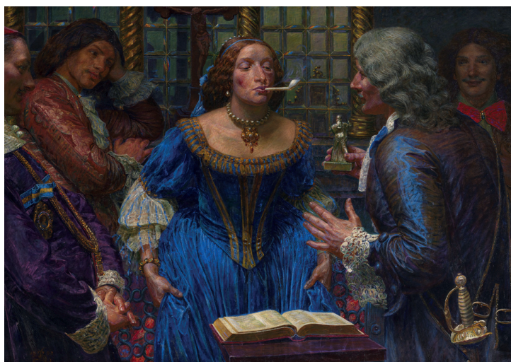
Dronning Kristina i Palazzo Corsini, 1908

Materialet sætter fokus på Kristian Zahrtmanns liv og kunst i forhold til det nutidige begreb queer . Ordet queer kommer fra engelsk og kan oversættes til 'skævt' på dansk. Queer kan både være noget, man gør, og noget, man er. Begrebet kan bruges til at beskrive handlinger, der udfordrer herskende forestillinger om køn og seksualitet. Det kan også være en fællesbetegnelse for personer, der ikke ser sig selv i forlængelse af samfundets normer for køn og identitet. Queer åbner op for, at identiteter kan være mere flydende og individuelle end de typiske 'identitetskasser', vi normalt putter os selv og hinanden i. I materialet anvendes queer -begrebet til at pege på det uventede og udfordrende i Zahrtmanns farverige kunst. Det gælder hans blik for smukke mænd og stærke kvinder såvel som hans iøjnefaldende selvportrætter.