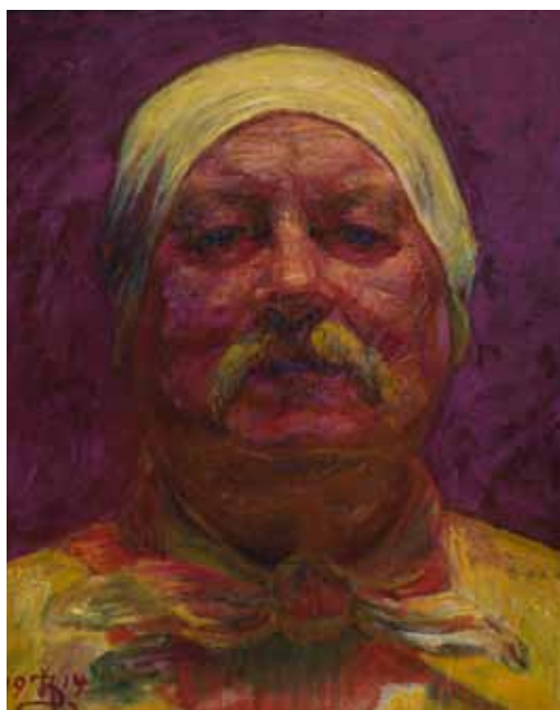
Selvportræt en face. Lampelys, 1914 Statens Museum for Kunst