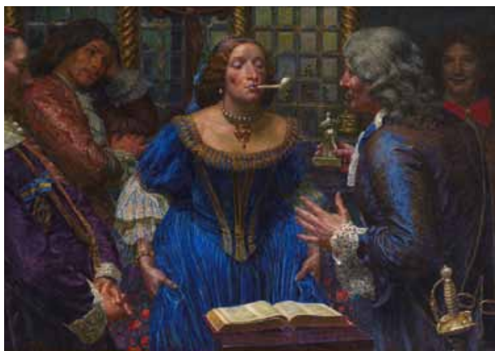
Dronning Kristina i Palazzo Corsini, 1908

Materialet sætter fokus på Kristian Zahrtmanns liv og kunst i forhold til det nutidige begreb queer . Ordet queer kommer fra engelsk og kan oversættes til 'skævt' på dansk. Queer kan både være noget, man gør, og noget, man er. Begrebet kan bruges til at beskrive handlinger, der udfordrer herskende forestillinger om køn og seksualitet. Det kan også være en fællesbetegnelse for personer, der ikke ser sig selv i forlængelse af samfundets normer for køn og identitet. Queer åbner op for, at identiteter kan være mere flydende og individuelle end de typiske 'identitetskasser', vi normalt putter os selv og hinanden i. I materialet anvendes queer -begrebet til at pege på det uventede og udfordrende i Zahrtmanns farverige kunst. Det gælder hans blik for smukke mænd og stærke kvinder såvel som hans iøjnefaldende selvportrætter.