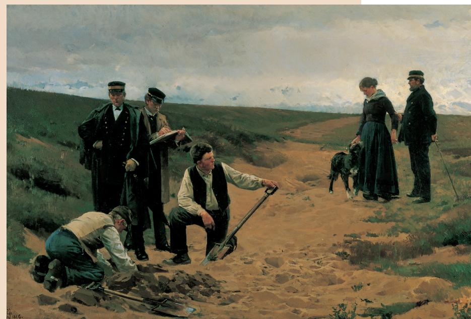
Erik Henningsen. Summum jus, summa injuria. Barnemordet , 1886