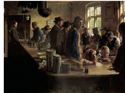
P.S. Krøyer. I købmandens bod, når der ikke fiskes , 1882. Olie på lærred, 79,5 x 109,8 cm.