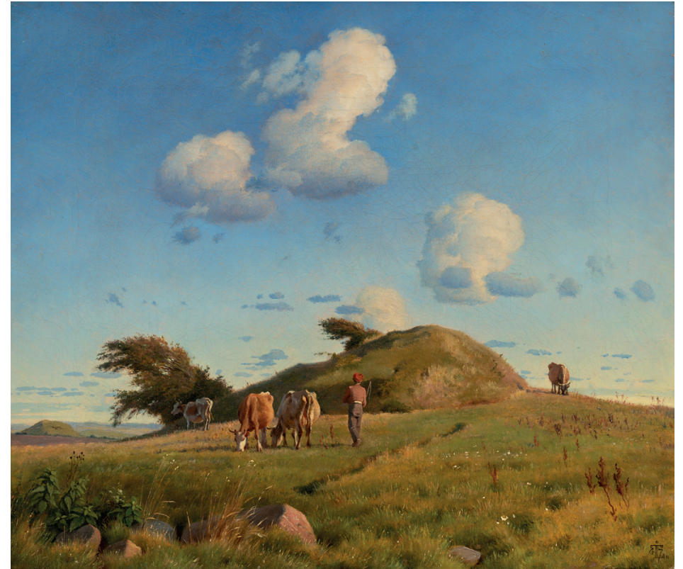
J.Th. Lundbye. Efterårslandskab. Hankehøj ved Vallekilde, 1847