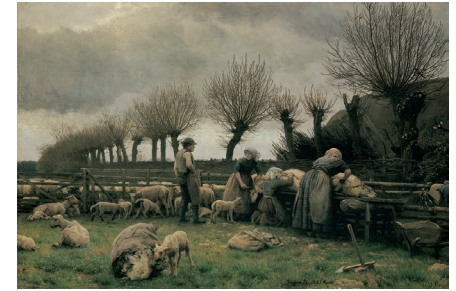
Joakim Skovgaard. Forårsfåreklipping på Lolland. Gråvej , 1881. Olie på lærred, 63 x 93,5 cm.