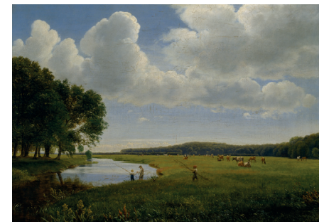
P.C. Skovgaard. Parti ved Halleby Å , 1847. Olie på lærred, 23,2 x 31,4 cm.