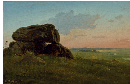
Carlo Dalgas. Aftenlandskab med en stendysse, studie , (1844). Olie på lærred, 13,7 x 21,3 cm