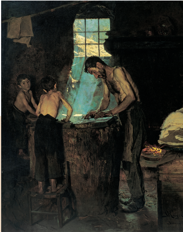
P.S. Krøyer. Italienske landsby- hattemagere , Sora, 1880