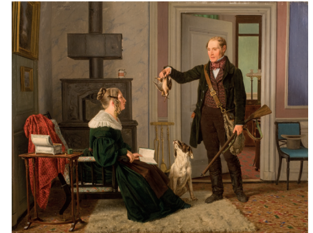
Martinus Rørbye. En jæger viser sin kone udbyttet af den første sneppejagt , 1839. Olie på lærred, 39 x 50 cm.