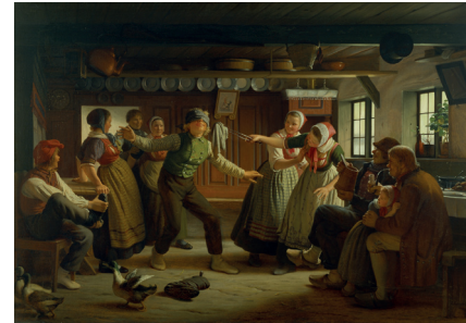
Julius Exner. Blindebuk , 1866. Olie på lærred, 82,3 x 118,5 cm.