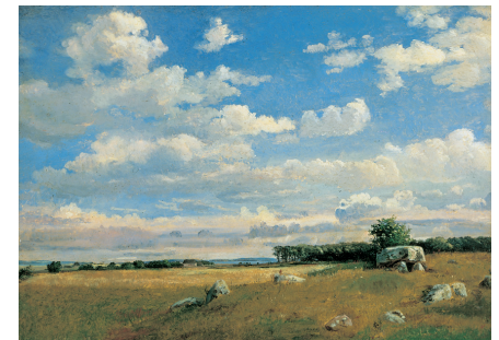
Dankvart Dreyer. Kæmpehøj på Brandsø , studie, ca. 1842. Olie på pap, 29,1 x 41 cm.