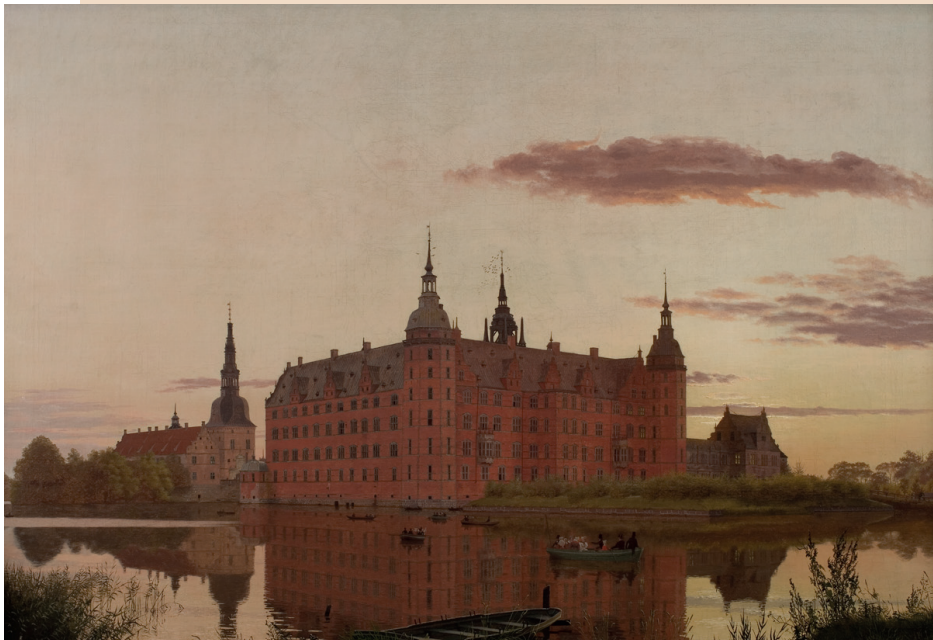
Christen Købke. Frederiksborg Slot set fra Jægerbakken. Aften, 1855

Kunstneren Christen Købke (1810-1848) malede billedet af Frederiksborg Slot som et svar på en konkurrence. Konkurrencen gik ud på at male et arkitekturmaleri af en offentlig bygning eller plads. Slottet er et dansk slot i Hillerød, som stod færdigbygget i 1625. Slottet blev i guldalderen set som et eksempel på fortidens storhed, og det passede derfor godt ind i den nationalromantiske tankegang.