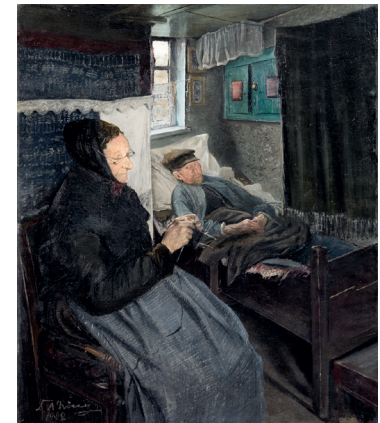
L.A. Ring. Den syge mand , 1902. Olie på lærred, 52,7 x 45,7 cm.