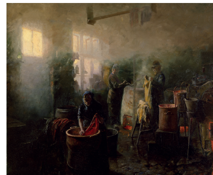
Ole Pedersen. I et farveri , 1887. Olie på lærred, 55,4 x 67 cm.