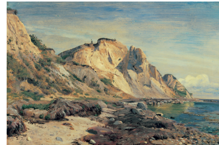
J.Th. Lundbye. Hellede Klint på Røsnæs , 1847. Olie på papir, 36,7 x 54,8 cm.