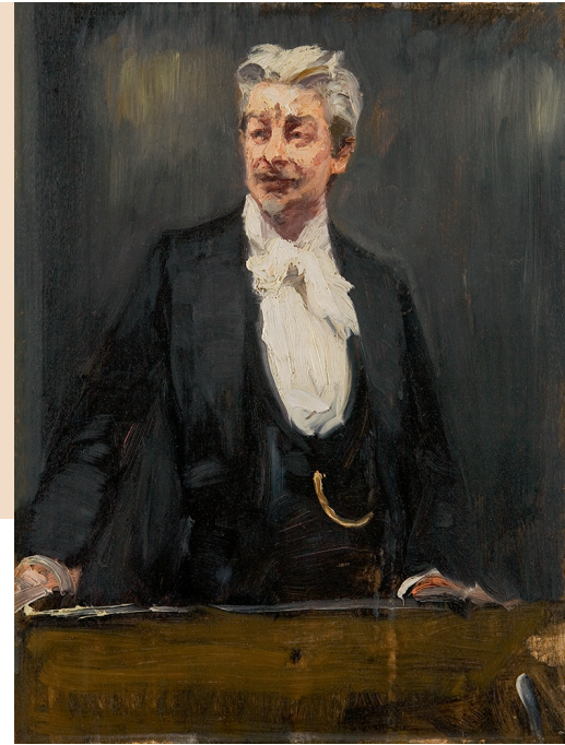
P.S. Krøyer. Portræt af Georg Brandes som foredragsholder , (1901)

Kunstnerne i det moderne gennembrud holder sig ikke længere til kun at vise det særligt danske og de pæne sider af samfundet. Nu viser kunsten også de grimme, hårde og ubehagelige sider af livet. Der vokser flere nye kunstretninger frem, blandt andet realisme og naturalisme.