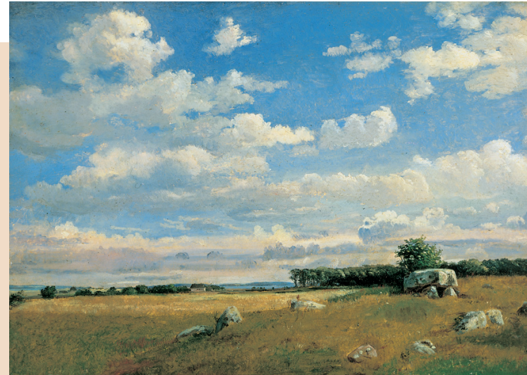
Dankvart Dreyer. Kæmpehøj på Brandsø, studie, ca. 1842

Guldalderkunsten tager ofte udgangspunkt i en stolthed over Danmarks natur og historie. Kunstnerne interesserer sig for folkesagn, folkedragter, nordisk mytologi og oldtiden samt gamle skikke og traditioner. Kunsten er påvirket af en nationalromantisk