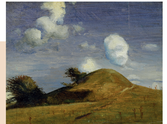
J.Th. Lundbye. Hankehøj på Vallekilde præstegårdsmark, ca. 1846