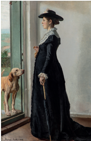
Michael Ancher. Portræt af min hustru. Malerinden Anna Ancher , 1884. Olie på lærred, 183,3 x 119,8 cm.

Herunder har vi udvalgt en række af museets værker fra det moderne gennembrud, som I med fordel kan bruge i forbindelse med arbejdet med perioden. Værkerne er gengivet i Powerpoint-filen, som kan downloades på museets hjemmeside her .