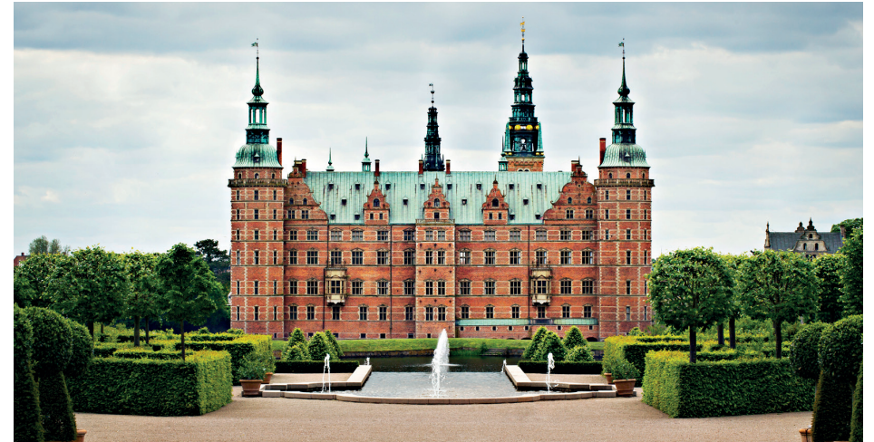
Pressefoto 2019 © Det Nationalhistoriske Museum på Frederiksborg Slot