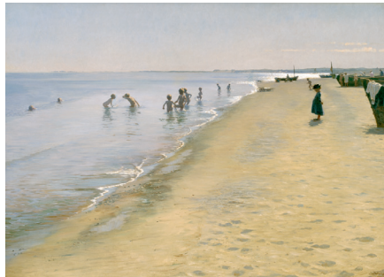
P.S: Krøyer. Sommerdag ved Skagens Sønderstrand , 1884. Olie på lærred, 154,5 x 212,5 cm.