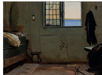
Christen Dalsgaard. En fiskers sove-kammer , 1853. Olie på papir. 36 x 49 cm.