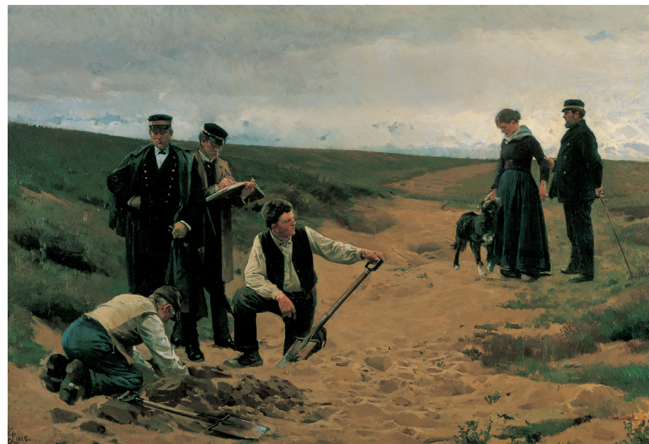
Erik Henningsen. Summum jus, summa injuria, Barnemordet , 1886

Erfaringskilder: Har oplevet historien på deres egen krop. En erfaringskilde kan f.eks. være en person, der har overværet den begivenhed, journalisten skal skrive om.