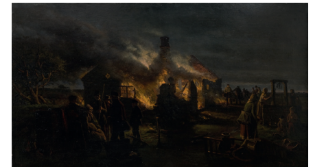
Hans Smidth. Ildløs, Natlig ildebrand på heden , 1904. Olie på lærred, 71 x 124,7 cm.