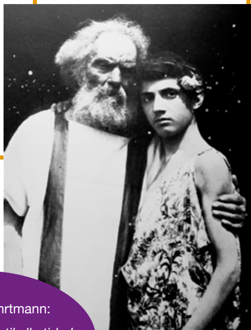
Wilhelm von Gloeden Ældre mand stående med en ung mand , udateret fotografi

Selv udtalte Zahrtmann: Menneskene er ens til alle tider! Der er ikke spor forskel på historiens skikkelser og på os.