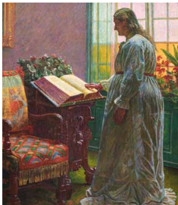
Leonora Christina i Maribo kloster, 1914 Fuglsang Kunstmuseum.

I dansk kunsthistorie* er der skrevet en del om Kristian Zahrtmann og hans kunst. Der er dog en gruppe af Zahrtmanns billeder, som vi meget sjældent ser eller hører om. Det er billeder, som viser mænd og kvinder, der ikke passer ind i normerne* for køn og seksualitet omkring år 1900. I nogle af dem er der homoseksuelle temaer. Andre steder bliver kønsrollerne* vendt på hovedet. Næsten alle disse billeder er i dag i privateje. De er med andre ord ikke på museerne, og derfor er der ikke så mange, som kender til dem. I dette materiale skal vi se nærmere på nogle af disse mindre kendte billeder fra Zahrtmanns hånd.