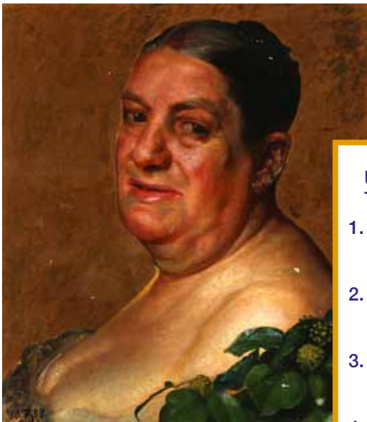
Madam Ullebølle som bacchantinde, 1888 Privateje.

I maleriet har Zahrtmann malet Ullebølle som bacchantinde. Bacchantinder var i den antikke græsk-romerske mytologi betegnelsen for de kvinder, som dyrkede guden Bacchus (også kaldet Dionysos). Bacchus var gud for vin og vilde fester.