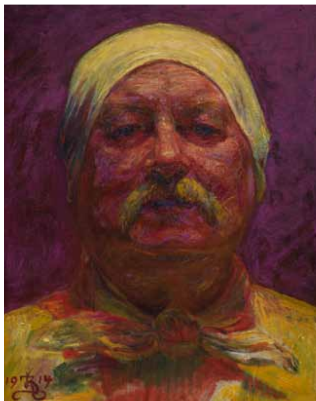
Selvportræt en face. Lampelys, 1914 Statens Museum for Kunst

Den gamle Mand har Humør og Farveglæde nok til at male sig selv med en dejlig gul Klud svunget som en Turban over sit graa Hoved. Han behøver ikke en sort Frakke med Ordner paa – jeg ved ikke om han har nogen – han er bare Maler Zahrtmann, der er ung nok til at forelske sig i en gul Klud og som kan have den svunget om Hovedet, uden at man finder det naragtigt.