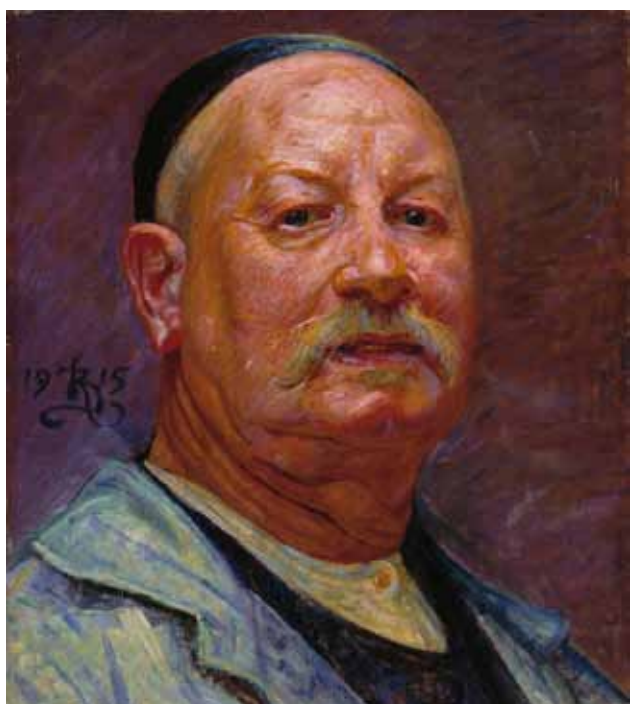
Selvportræt, 1915 Finlands Nationalgalleri, Ateneum www.kansallisgalleria.fi , public domain

Selvportrætter handler om at fortælle verden, hvem man er. De viser ofte, hvordan man ser ud udenpå, men også hvordan man er indeni. Man kan sige, at de på den måde afspejler en persons identitet. Selvportrætter er altså aldrig neutrale spejlbilleder. De vil altid være udtryk for en række valg såsom posering, mimik, tøj, baggrund, farver osv. Ofte handler selvportrætter om, at man gerne vil have andre mennesker til at tro, man er på en bestemt måde. De kan altså også vise, hvem man godt kunne tænke sig at være.