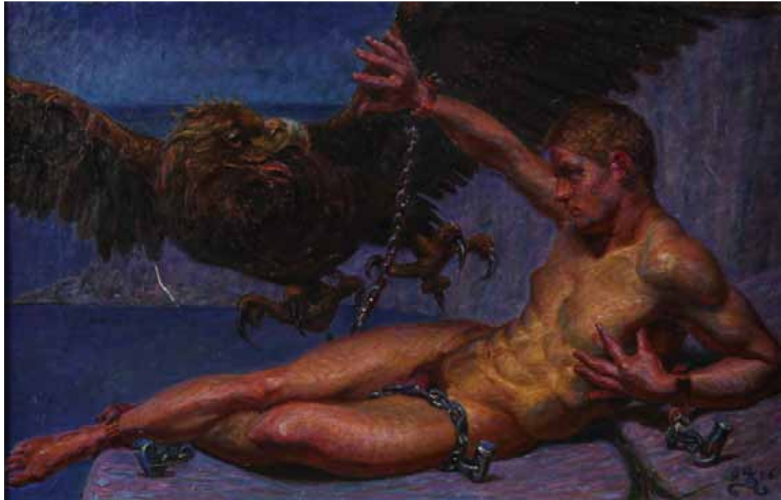
Prometheus, 1906. Privateje.

I billedet til højre har Zahrtmann malet den græske gud Prometheus, der er blevet straffet for at hjælpe menneskene ved at give dem ilden. Han er lænket til en klippe, og Zeus' ørn er på vej til at æde hans lever.