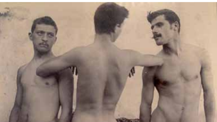
Under sagen konfiskerede politiet kærlighedsbreve skrevet til og fra mænd samt erotiske og pornografiske billeder af mænd. Her ses et af de konfiskerede billeder.

Zahrtmann havde mange venner, men vi ved ikke, om han havde noget kærlighedsliv. Han udtalte sig aldrig om sin egen seksualitet, men i flere af hans malerier er der homoseksuelle temaer. På Zahrtmanns tid var det forbudt at være praktiserende homoseksuel mand i Danmark. Man kunne endda risikere fængselsstraf. Det var derfor slet ikke ufarligt for en mandlig maler at male nøgenbilleder af andre mænd. Alligevel malede og udstillede Zahrtmann flere billeder af nøgne mænd – og selvom nogle af dem skabte forargelse, slap han afsted med det. I det følgende undersøger vi, hvordan det var at være homoseksuel mand i Danmark omkring år 1900. Vi undersøger også, hvordan Zahrtmann præsenterede homoseksualitet i sine billeder.