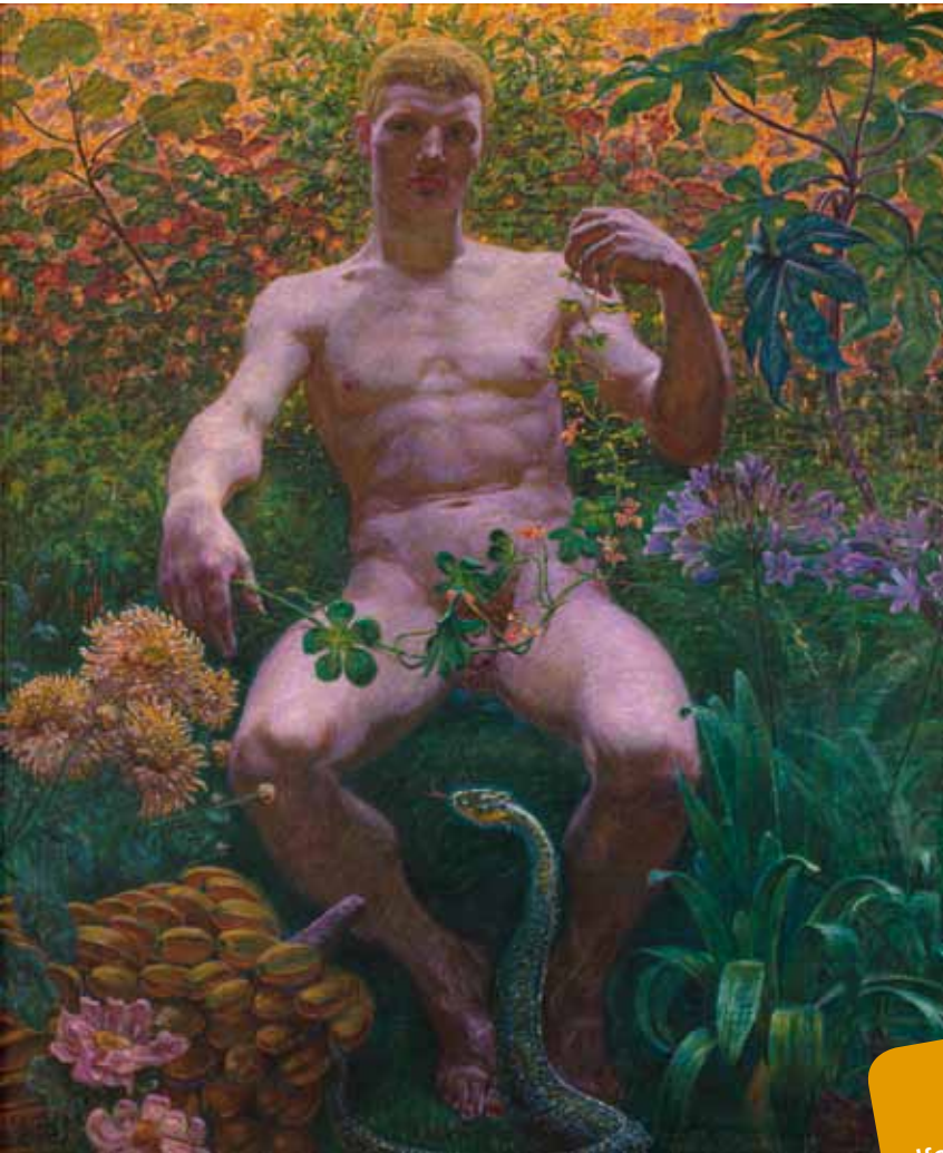
Adam i Paradis , 1914. Privateje.

Adam og Eva er fortællingen om menneskets skabelse. Det er også fortællingen om, at der findes to forskellige køn, manden og kvinden, og at de to køn supplerer* hinanden. Og så er det en fortælling, som er blevet brugt til at retfærdiggøre mænds højere sociale status. Ofte bliver Adam og Eva malet sammen, men i Zahrtmanns maleri sidder Adam alene med den lumske slange.