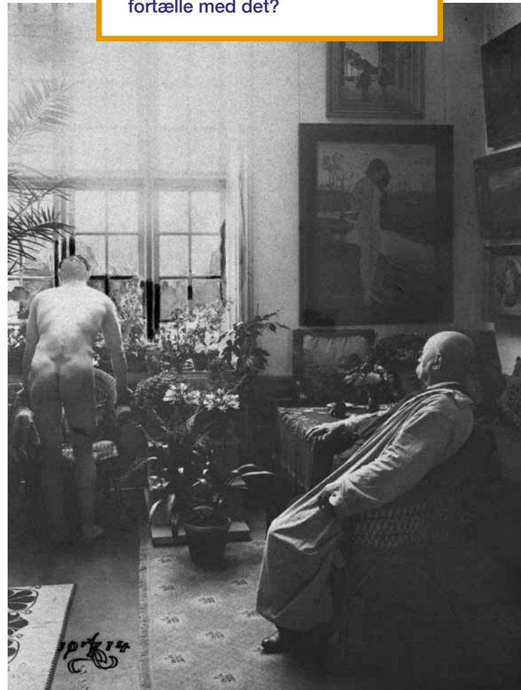
Kristian Zahrtmann i sit atelier, 1914.

Tror du, at fotografiet fra atelieret er iscenesat af Zahrtmann selv? Og i så fald: Hvad ville han mon fortælle med det?