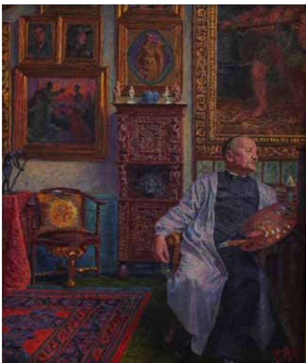
Selvportræt i hjemmet, 1916

I materialet undersøger vi, hvordan opfattelsen af køn og seksualitet har ændret sig fra Zahrtmanns tid til i dag. Vi undersøger også, hvordan hans kunstværker taler ind i samfundsdebatter og udfordrer den måde, vi tænker og tidligere har tænkt på os selv og hinanden.