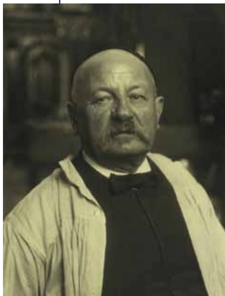
Portræt af Kristian Zahrtmann ca. 1900

I slutningen af 1800-tallet fik fotografiet sit brede, folkelige gennembrud. Nu var man ikke længere afhængig af en kunstner for at få skabt et billede af sig selv. Det var dog en langsommelig proces at tage et billede – slet ikke som vores tids hurtige og spontane snapshots med mobiltelefonen. Dengang havde kameraet en lang eksponeringstid, og man skulle sidde helt stille for at undgå, at fotografiet blev sløret. Derfor var tidens fotografier ofte nøje planlagte og iscenesatte.