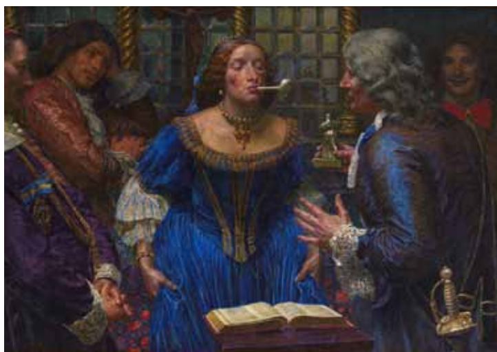
Dronning Kristina i Palazzo Corsini, 1908

Materialet sætter fokus på Kristian Zahrtmanns liv og kunst i forhold til det nutidige begreb queer . Ordet queer kommer fra engelsk og kan oversættes til 'skæv' på dansk. Queer kan både være noget, man gør, og noget, man er. Begrebet kan bruges til at beskrive handlinger, der udfordrer herskende forestillinger om køn og seksualitet. Det kan også være en fællesbetegnelse for personer, der ikke ser sig selv i forlængelse af samfundets normer for køn og identitet. Queer åbner op for, at identiteter kan være mere flydende og individuelle end de typiske 'identitetskasser', vi normalt putter os selv og hinanden i. I materialet anvendes queer -begrebet til at pege på det uventede og udfordrende i Zahrtmanns farverige kunst. Det gælder hans blik for smukke mænd og stærke kvinder såvel som hans iøjnefaldende selvportrætter.